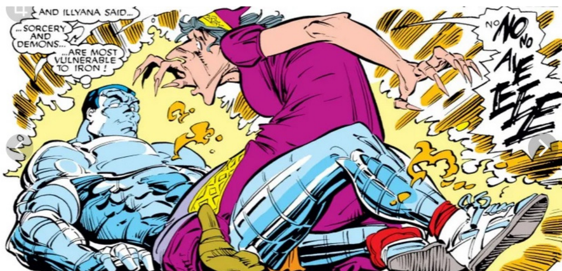
Рис. 4. Баба-Яга из Uncanny X-Men .

Ее облик здесь разительно отличается от Яги из комикса о Капитане Британии. Это возможно еще и потому, что персонажа как бы «извлекают» из головы Ильи, а для него Яга все же считается знакомым персонажем в силу происхождения. И вновь мы видим черты, которые видели в Бабе-Яге из DnD и ведьме из Белоснежки: крючковатый нос и руки с острыми ногтями, больше напоминающими когти. Однако сам образ этой Яги скорее напоминает о ведьме из сказки «Ганзель и Гретель» [Гримм Я, Гримм В, 2020], чем о Бабе-Яге, от которой персонажу достается только имя.