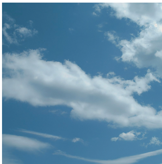
Рис. 6б. Этих облаков никогда не существовало. Изображение, сгенерированное нейросетью tuDALL-E по запросу: «облако в небе». 12.10.2023. Сгенерировано авторами статьи для данной публикации.