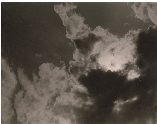
Рис. 5б. Альфред Стиглиц. Эквиваленты. 1925.