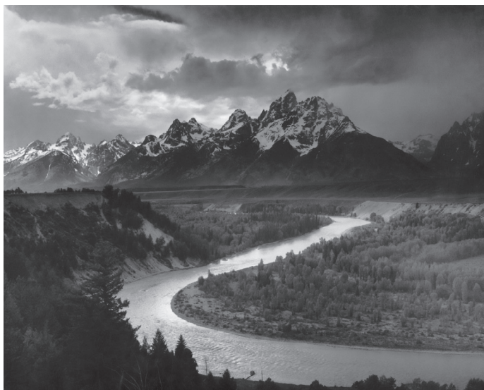
Рис. 1. Ансель Адамс (Ansel Adams). Фотография «Вершины Титона и река Снейк», 1942 год. Частное собрание.

Процесс имитации стиля фотографа или художника начинается с тренировки нейросети на большом наборе данных, включающем фотографии или произведения искусства, выполненные в определенном стиле. Нейросеть выявляет общие черты и уникальные элементы, которые характеризуют данный стиль. Затем, после завершения тренировки, нейросеть может применять полученные знания к изображениям, создавая картины «как у ван Гога» и фотографии «под Ансельма Адамса» (рис. 1-2). Такая технология стилизации находит широкое применение в фото- и графических редакторах. К примеру, в 2023 г. многофункциональный растровый графический редактор Adobe Photoshop «обзавёлся» функцией Generative Fill. Данная ситуация порождает основания для юридических претензий к создателям нейросети, а также к тем пользователям, которые, к примеру, воспроизводят фирменный стиль того или иного художника.