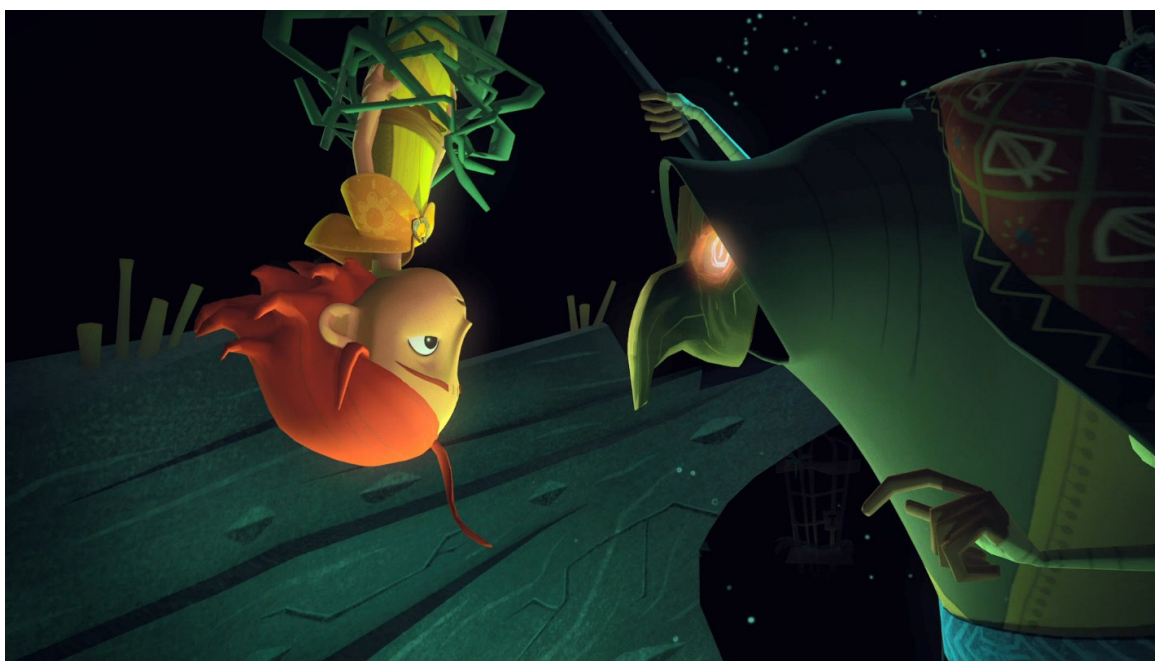
Рис. 11. Скриншот из игры Baba Yaga (Baobab Studios, 2021).

Перейдем к последнему вышедшему на данный момент проекту: визуальная VR-новелла 2021 года “baba Yaga” (рис. 11). Это короткая сказка про двух сестер, которые пытаются спасти свою больную мать. Для этого они отправляются в мистический лес, чтобы попросить о помощи Бабу-Ягу. Яга здесь хранительница леса, которая оберегает его от людей. И она не ест людей, как и Яга из игры 2019 года, что выделяет их обеих среди других воплощений персонажа. Причем об этом мы узнаем исключительно в ходе повествования, а изначально нам дается совершенно другая информация. Все дело