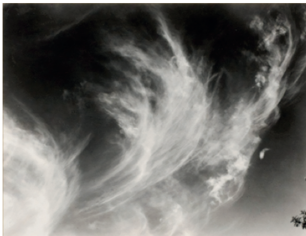
Рис. 5а. Альфред Стиглиц. Эквиваленты. 1930.