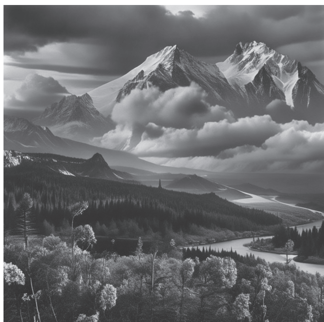
Рис. 2. Изображение, сгенерированное нейросетью «Шедеврум» в стилистике А. Адамса 12.10.2023. Сгенерировано авторами статьи для данной публикации.