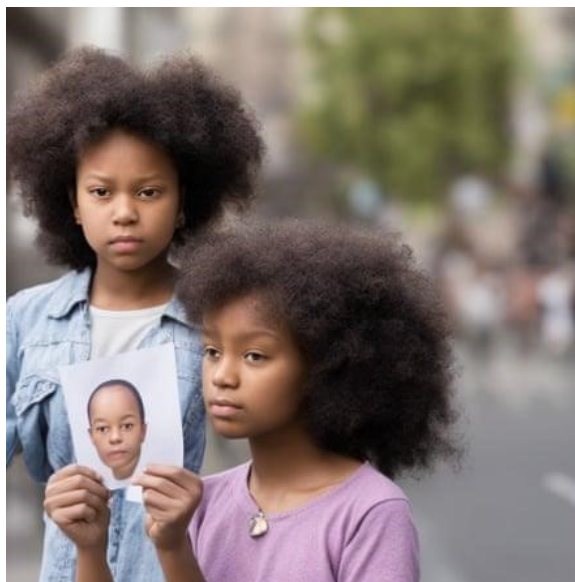
Рис. 4. Изображение, сгенерированное художницей Элизабет Прайс по запросу: «Как ты понимаешь расовую идентичность?»