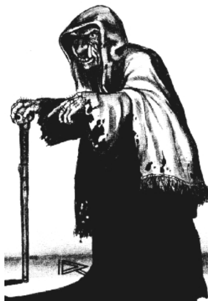
Рис. 2. Ведьма. Кадр из мультфильма «Белоснежка» (1937).