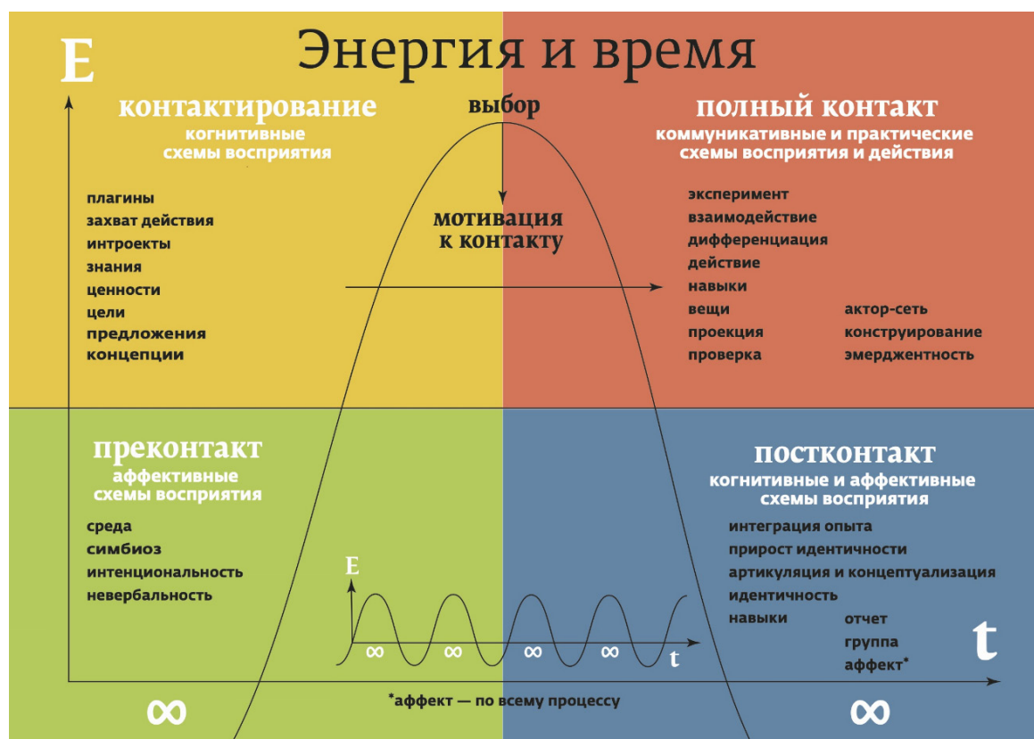
Рис. 6. Концептуальная модель контакта и взаимодействия акторов.

Основываясь на анализе дискурса, отзывов и воспоминаний, рассмотрим сам парк как актора с собственной агентностью. На графике (рис. 6) представлена концептуальная модель контакта и взаимодействия в среде, позволяющая выявить действующие и мотивирующие к действию силы, акторов, по АСТ.