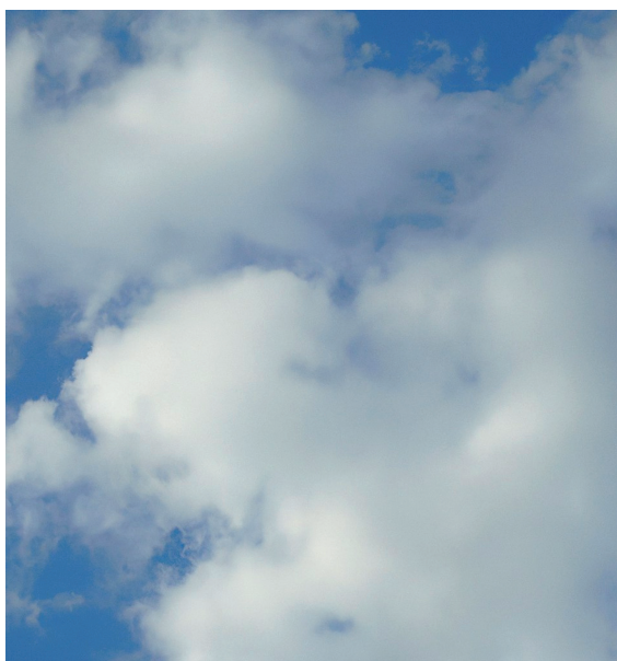
Рис. 6а. Этих облаков никогда не существовало. Изображение, сгенерированное нейросетью tuDALL-E по запросу: «облако в небе». 12.10.2023. Сгенерировано авторами статьи для данной публикации.