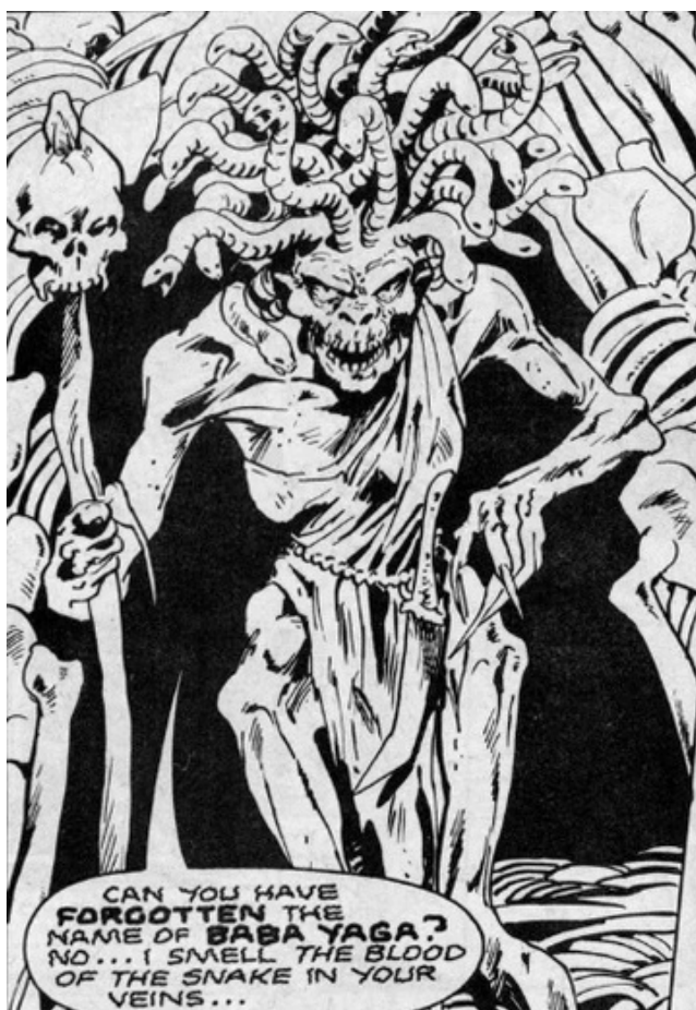
Рис. 3. Яга из комикса «Капитан Британия» (том 2).

Выглядит эта Яга весьма специфично, и в ней как сохраняются ведьмовские черты, так и добавляется больше монструозности, хотя и не имеющей отношения к славянскому фольклору. Она скорее отсылает своим обликом к Медузе Горгоне своими змеями на голове и одеждой на манер тоги. Тело же ее – это скелет, обтянутый кожей, однако сохраняется черта, которую мы уже видели у Бабы-Яги. Это руки с заостренными когтями. С Бабой-Ягой славянского фольклора ее роднят силы. Она могла управлять созданиями леса и летать на метле. А вот некромантия, которой она владела, пришла явно не из фольклора. И то, что, как и Баба-Яга из сказок, она тоже является людоедкой, причем образ ближе именно Яге, а не злой ведьме, поскольку в ее рацион входят не только дети, но и люди любого возраста.