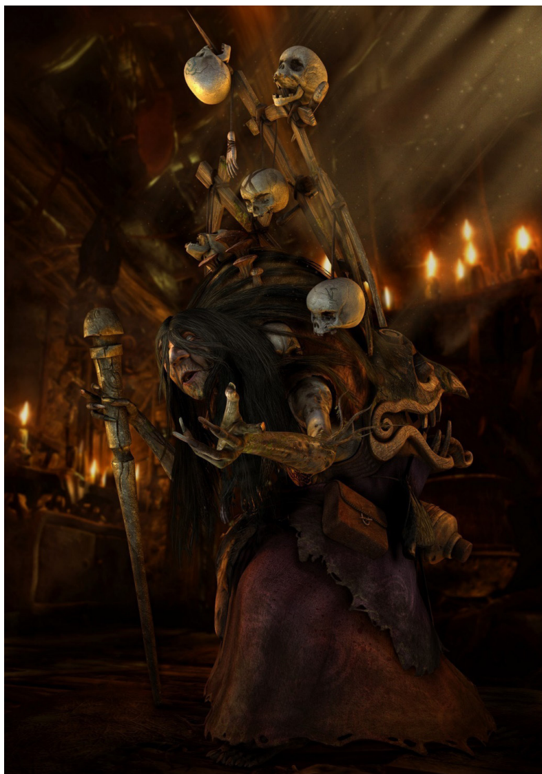
Рис. 9. Скриншот из игры Castlevania: Lords of Shadow (Konami, 2010).

Начнем с игры “Castlevania: Lords of Shadow” (рис. 9). Здесь Баба-Яга становится стражем границы между миром мертвых и миром живых, о чем размышлял В.Я. Пропп [Пропп, 2021].