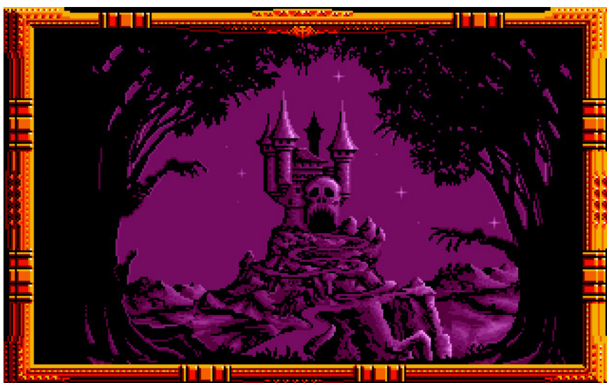
Рис. 8. Скриншот из игры Once upon a time baba yaga (Coktel Vision, 1991).