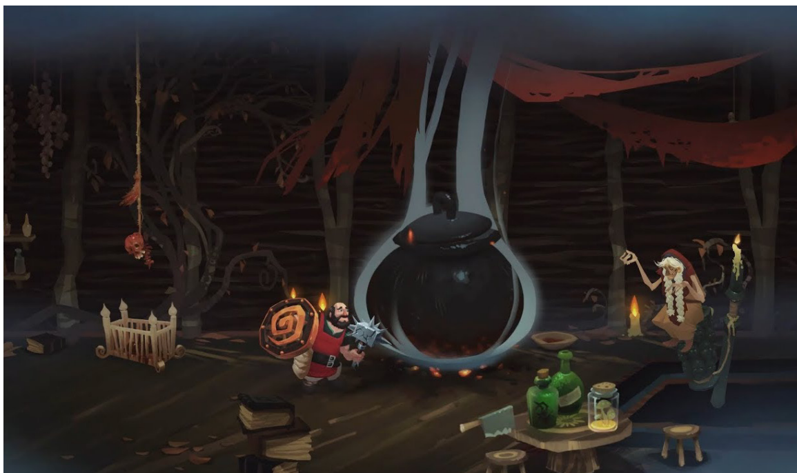
Рис. 10. Скриншот из игры Yaga (Breadcrumbs Interactive, 2019).

“Yaga” – в целом проект достаточно уникальный, переносящий на видеоигровую почву и персонажей, и сказочные сюжеты, и сами структуры, в которых воспроизводится фольклор. Если попробовать пересказать ее сюжет, то его будет невозможно отличить от простой волшебной сказки.