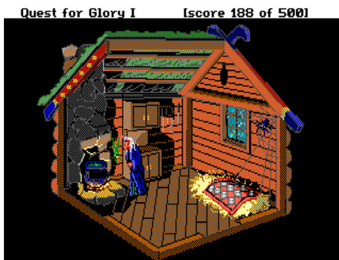
Рис. 6. Скриншот из игры Quest for glory (Sierra Entertainment, 1989).

Начнем анализ с серии квестов Quest for Glory , где Баба-Яга появляется в сюжете первой и четвертой части. В первой (рис. 6) визуально этот персонаж – обычная старушка, хоть и обладающая магией, живущая в хижине у города. Седые волосы, обвислые груди, старческий возраст. Так вполне может выглядеть любая пожилая женщина, нет чего-то, что могло бы указывать нам на сверхъестественного персонажа, каким является Баба-Яга. Однако она носит балахон, который относится к