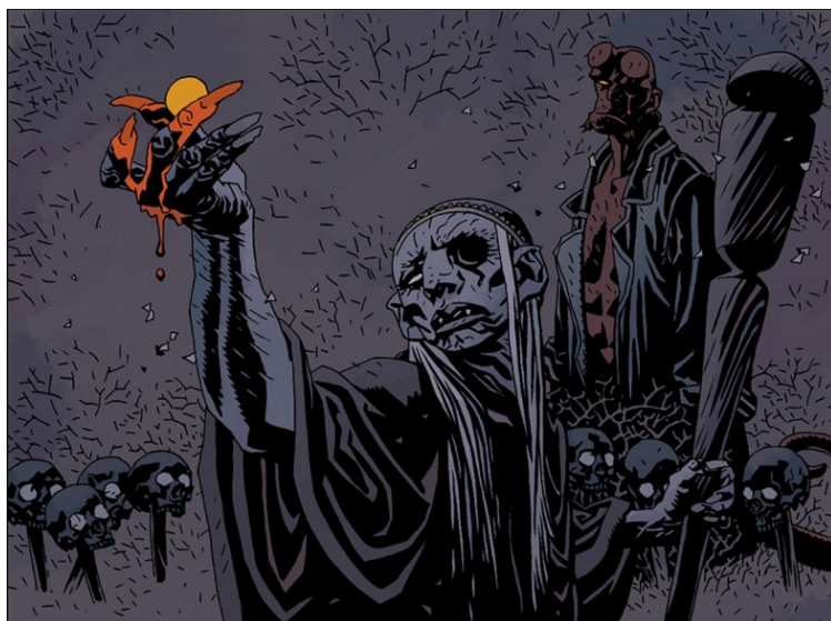
Рис. 5. Баба-Яга из серии комиксов «Хэллбой».

роли антагонистки, а не на ее внешнем облике. Баба-Яга на малых экранах, по мнению исследователей, чаще всего предстает в образе «монстра недели», а не главного антагониста. Это чудовище, угрожающее благополучию семьи героев, людоед, охотящийся на детей. Авторы также замечают, что если в роли «монстра недели» Баба-Яга причиняет вред другим людям, в том числе и своим союзникам, делая это ради личной выгоды, то она всегда получает по заслугам и погибает, что не всегда случается с ней в традиционном фольклоре, где она может в том числе выступать в качестве помощника. Авторы приводят в пример персонажа Бабы-Яги из мультфильма про Скуби-Ду, сериалов Сверхъестественное , Потерянная девушка , аниме Soul Eater . И если в остальных проектах это действительно победа над злодейкой, то в Скуби-Ду мы скорее сталкиваемся с «расколдовыванием мира». Данный кейс будет рассмотрен в проекте Baba Yaga: The Temple of the Witch , где мы столкнемся с аналогичной ситуацией.