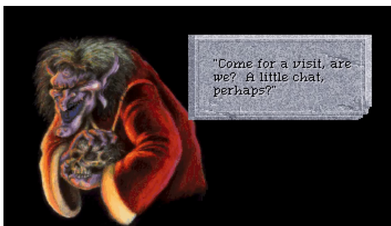
Рис. 7. Скриншот из игры Quest for Glory: Shadows of Darkness (Sierra Entertainment, 1994).

А вот об игре «Once upon a time baba yaga» не получится сказать много. Это образец абсолютно детских квестов, в которых никогда не уделялось особое внимание ни дизайну персонажей, ни сюжету. Главная его задача – быть хорошим развлечением. Поэтому здесь мы можем наблюдать достаточно любопытное жилище Бабы-Яги. Это средневековый замок с воротами в виде черепа (рис. 8). Такой замок с большей долей вероятности мог бы принадлежать фольклорному Кощею, чем Яге.