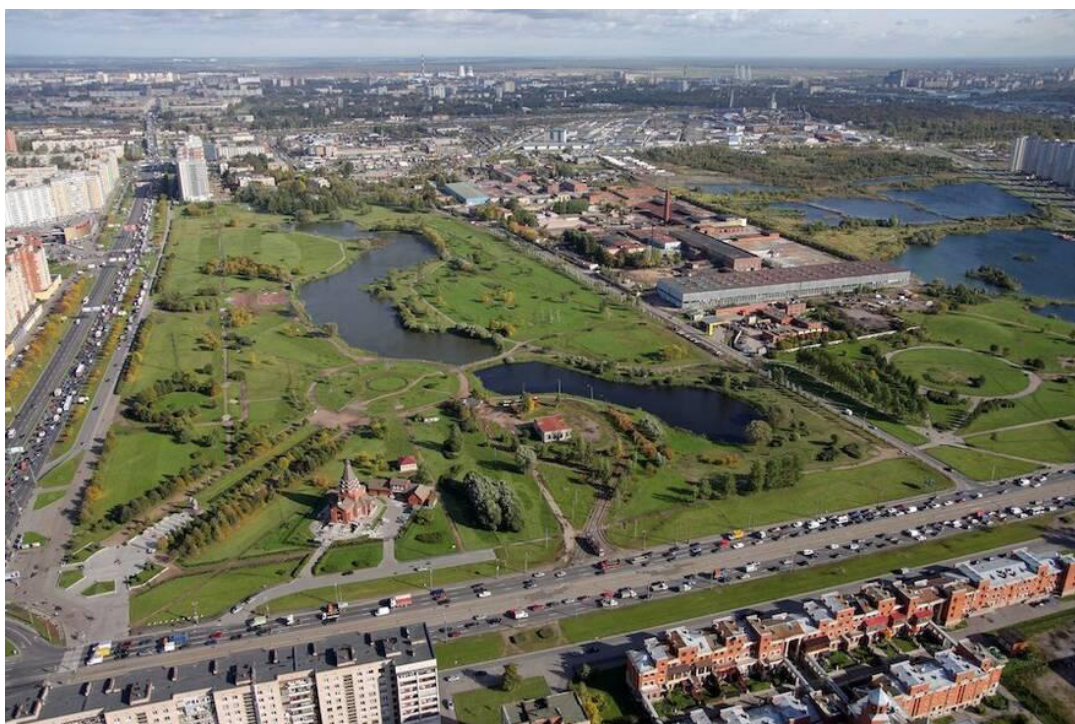
Рис. 1. Фотография парка Интернационалистов с сайта «novostroy».

Рассмотрим географическое положение парка Интернационалистов. Фотография (рис. 1) сделана до 2014 года, когда на месте фаянсового и керамического заводов начали строить жилой комплекс