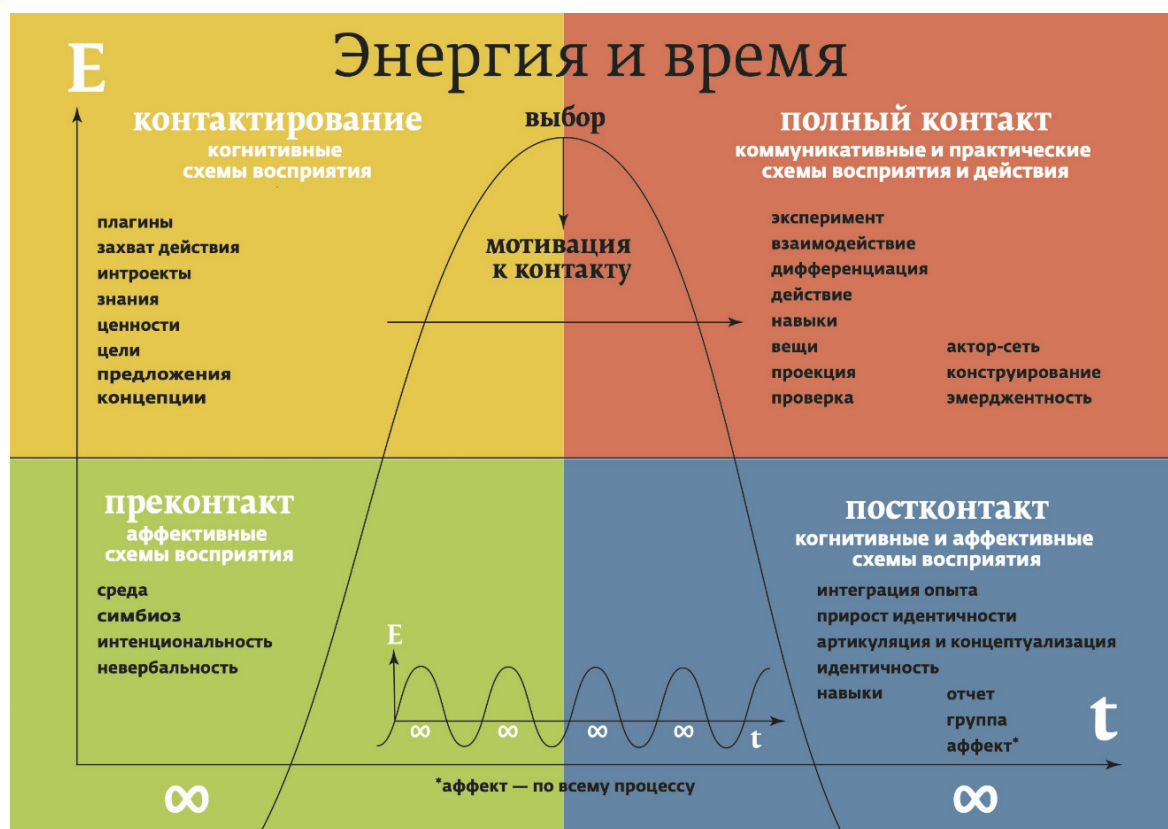
Рис. 6. Концептуальная модель контакта и взаимодействия акторов.

Основываясь на анализе дискурса, отзывов и воспоминаний, рассмотрим сам парк как актора с собственной агентностью. На графике (рис. 6) представлена концептуальная модель контакта и взаимодействия в среде, позволяющая выявить действующие и мотивирующие к действию силы, акторов, по АСТ.