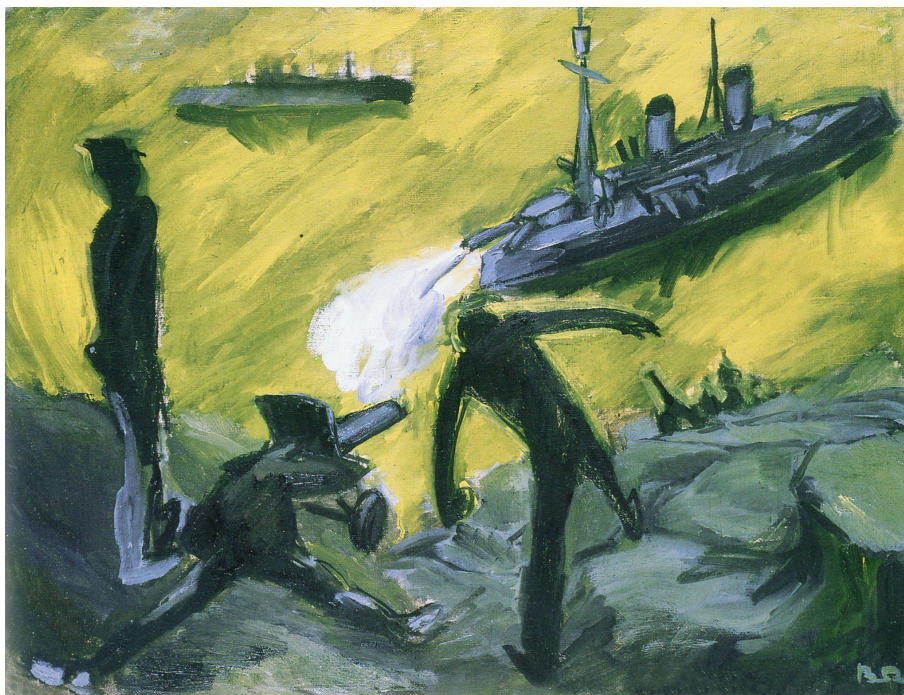
Рис. 2. Н. Витинг «Интервенция» 1929 г., холст, масло 53 x 71 см. Государственная Третьяковская галерея.

силуэты, контрастные цвета, дерганный мазок, максимальная экспрессия образа, но общий колорит ярче и теплее, а впечатление от работ легче. Например, на холсте «Интервенция» 1929 года (рис. 2) Витинг намеренно использовал пластический язык экспрессионизма: ядовитый контраст желтого и серовато-голубого, черные ломаные контуры, белые акценты, беспокойные штрихи, напряженные силуэты защитников рубежей Родины, ошестинившиеся корабли захватчиков – это очень значимая страница истории, когда судьба страны висела на волоске, как о таком можно говорить спокойно? Но работа производит позитивное впечатление: это острый момент, который был преодолен благодаря усилиям Красной армии, теперь задача художника – отразить героику этой борьбы, передать стойкость защитников, которые, как вертикальный, почти неподвижный и монолитный силуэт в левой части работы, не пропустили интервентов, встали непреодолимой стеной.