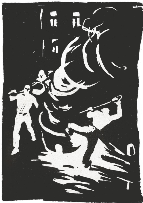
Рис. 4. Н. Витинг «Разогревают битум» 1929 г., линогравюра, 12,5 x 9 см., частное собрание.