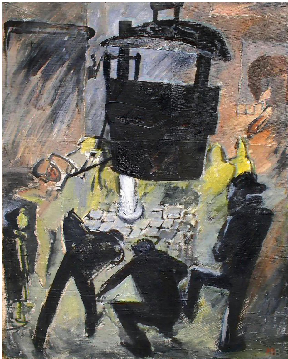
Рис. 3. Н. Витинг «На заводе “Серп и Молот”» 1927 г., холст, масло 73 x 58 см. ГБУК МО «Музей “Новый Иерусалим”».

В печатной графике Витинг также уделял много внимания теме труда и производства, отражая экспрессивными графическими приёмами динамику социальных и экономических преобразований: яркий контраст черного и белого, остроугольные силуэты, диагональная композиция – происходящее на листах закручивается в тугую спираль, герои исполняют свой ритуальный танец созидания нового мира. Это не тот труд,