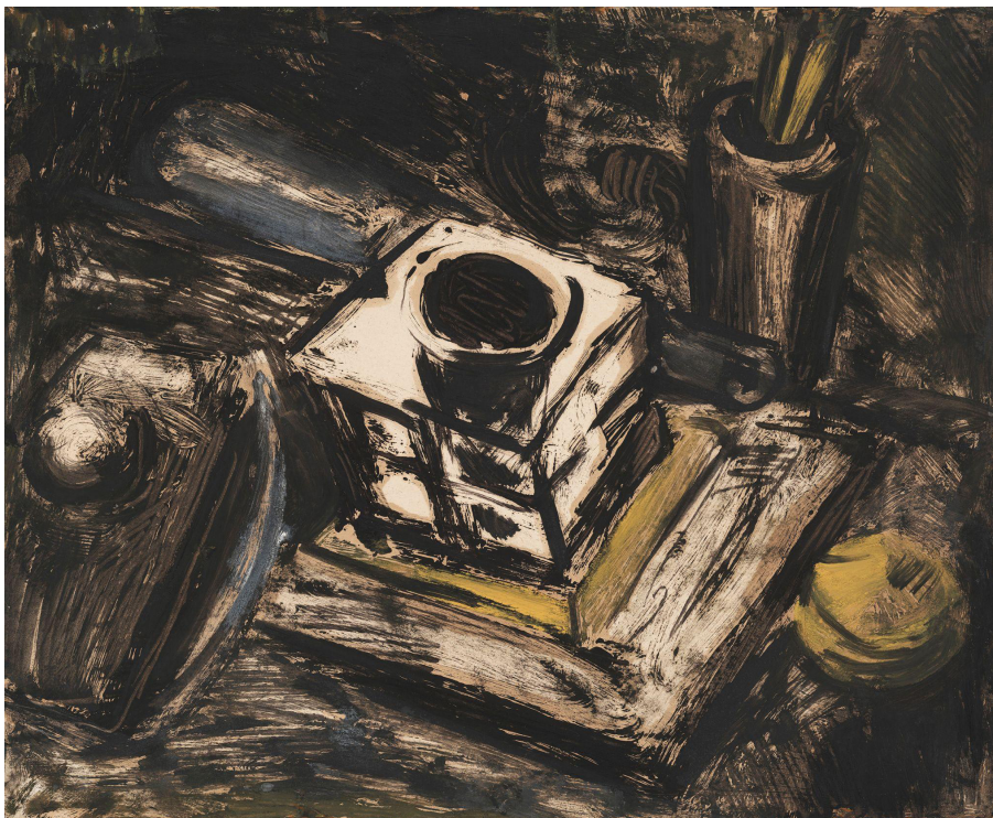
Рис. 1. Н. Витинг «Чернильница отца» 1931 г., бумага, монотипия, 35,4 x 42 см. ГБУК МО «Музей "Новый Иерусалим"».