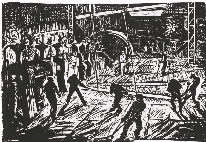
Рис. 5. Н. Витинг «Рельсопрокатный цех» из серии «Первая пятилетка» 1929 г., линогравюра, 24 x 30 см., ГБУК МО «Музей "Новый Иерусалим"».

который изображали передвижники или немецкие экспрессионисты 2 , стараясь передать социальную несправедливость и тяжесть положения низших слоев общества, – советский труд должен был человека облагораживать, превращать в творца новой жизни, её демиурга. Повышенная экспрессия изображения визуализировала этот мистический процесс, задавала нужное настроение (рис. 4-5).